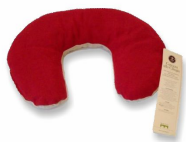
Collare di noccioni di ciliegio