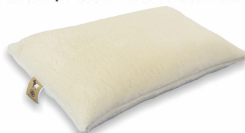
Federa lana MERINOS